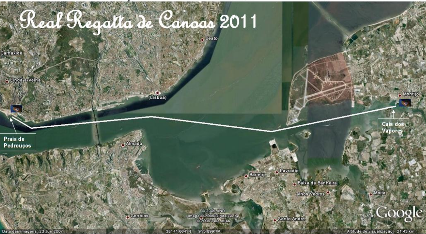
Percurso da Real Regatta de Canoas - 02 de Outubro de 2011 - Praia de Pedrouços / Cais dos Vapores (Montijo)